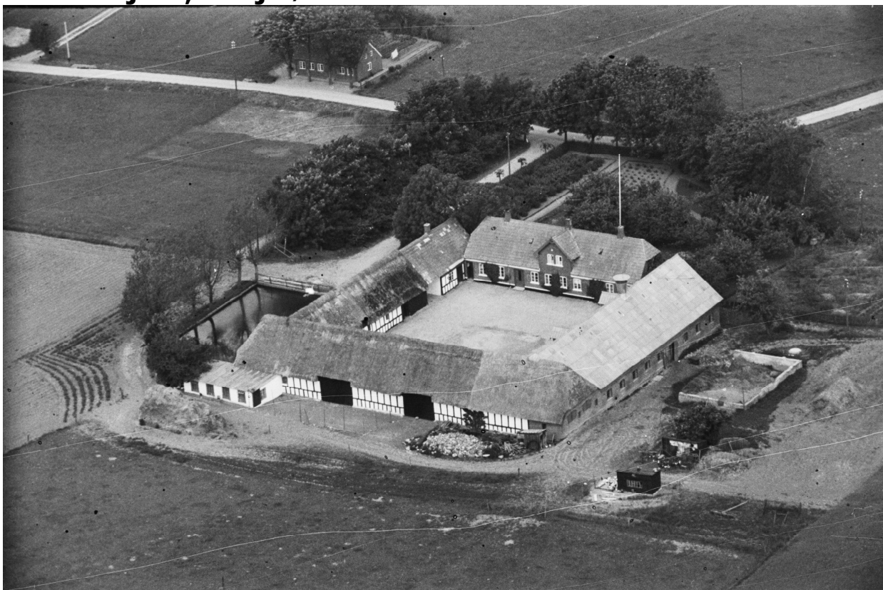
Foto: Danmark set fra luften

Matr. nr. 25a (Gl. Matr. nr. 14a) Nu matr 25a, 15q(3stk), 16e, 27b, 27c Ulkærvej 37, Grejs Østermark