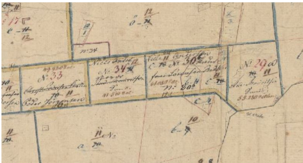
Historiske kort 1815 - 1864