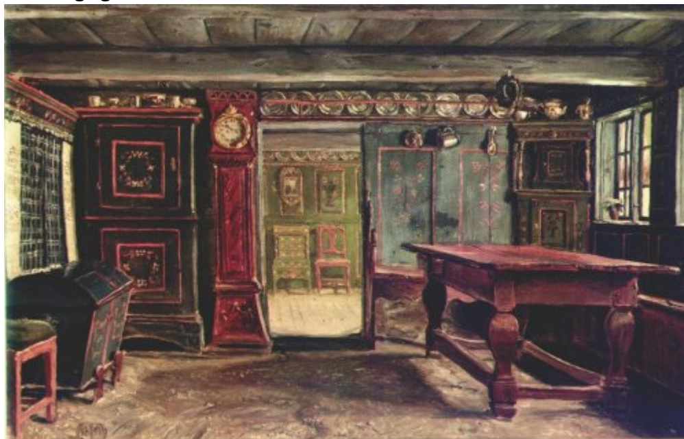
Christen Dalsgaard: Bondestue fra Sjælland 1847 (tidligere kaldet Bondestue i Salling). 95,5 x 41,5 cm. Den Hirschsprungske Samling.