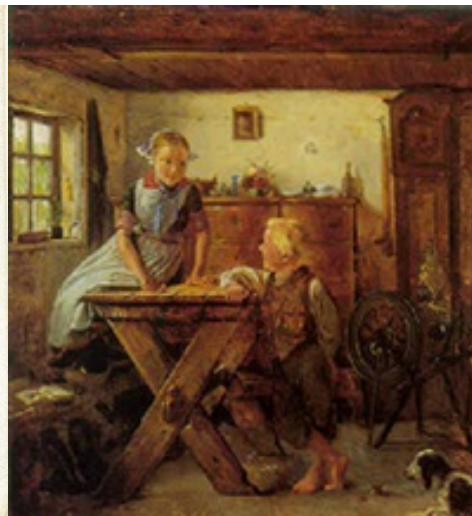
Bondestue fra Sognet over 200 Aar gl.