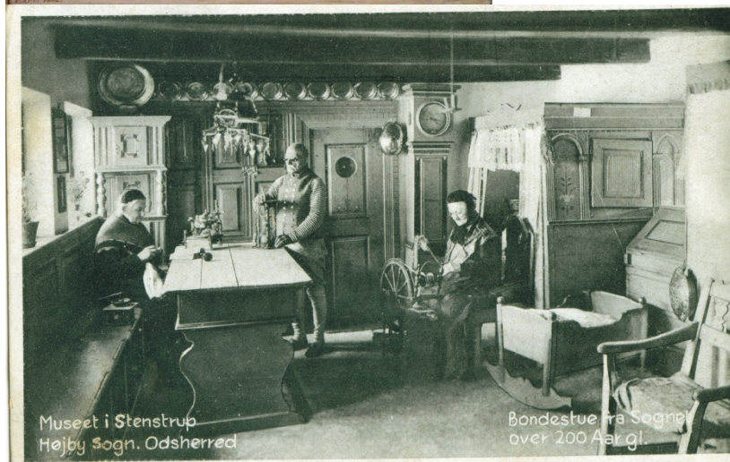
Museet i Stenstrup Højby Sogn, Odsherred