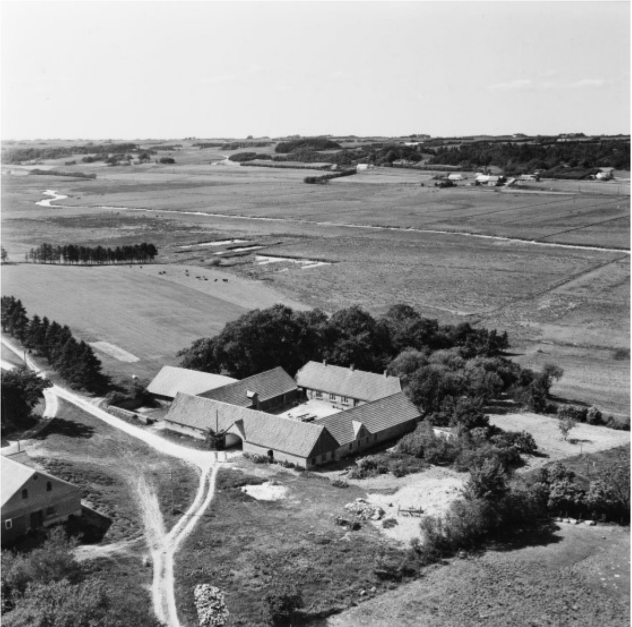
Luftfoto fra omkring 1952. Danmark set fra luften