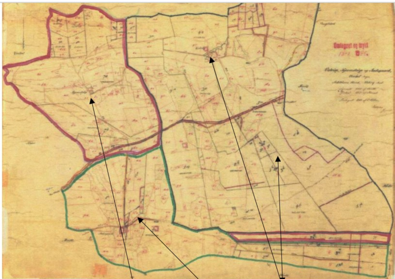
Kortet viser Kærrestrup (rød), Aadsgaard (grøn) og Vigstrup (sort).

Gården var ifølge matriklen 1664 på hartkorn: 6 tønder, 4 skæpper, 0 fjerdingkar og 1 3/5 album. De skulle i landgilde sammen svare 1 ørte rug, 1 ørte byg, 1 ørte havre, 1 svin I 1688-matriklen blev gårdens hartkorn ændret til: 9 tønder, 5 skæpper, 1 fjerdingkar og 2 album. Det var altså en meget stor gård, og det ser ud til på kortet, at gården var større end Aadsgaard og Kærrestrup tilsammen.